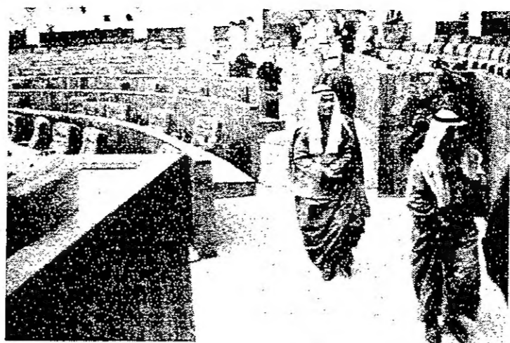
ويعد ان رفع الجلسة يغادر القاعة